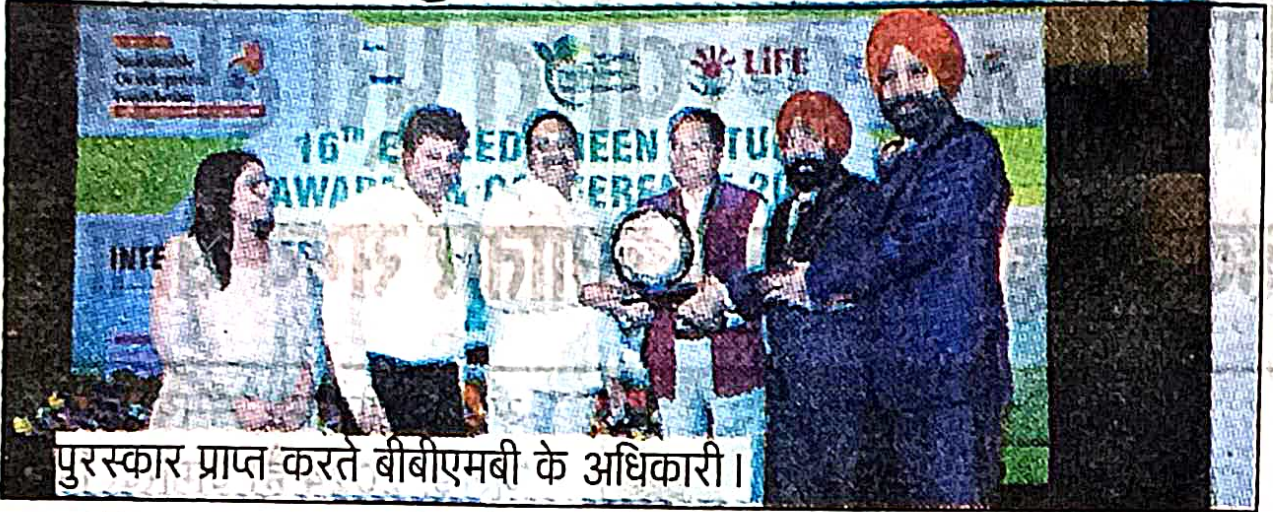
पुरस्कार प्राप्त करते बीबीएमबी के अधिकारी।

गुवाहाटी (उत्तम हिन्दू न्यूज): गुवाहाटी में बीबीएमबी के अध्यक्ष, बीबीएमबी ने जल प्रबंधन के क्षेत्र में बीबीएमबी की असाधारण उपलब्धियों के लिए प्लैटिनम पुरस्कार प्राप्त करने हेतु बीबीएमबी के सभी कर्मचारियों को हार्दिक बधाई दी। यह प्रतिष्ठित पुरस्कार 02 अगस्त, 2024 को हैदराबाद में आयोजित 16वें एक्सीड ग्रीन फ्यूचर पर्यावरण, एचआर और सीएसआर अवार्ड्स एंड कॉन्फ्रेंस 2024 में प्रदान किया गया। सतत विकास फाउंडेशन (एक काम देश के नाम) द्वारा आयोजित यह कार्यक्रम हरित और अधिक टिकाऊ भविष्य के प्रति